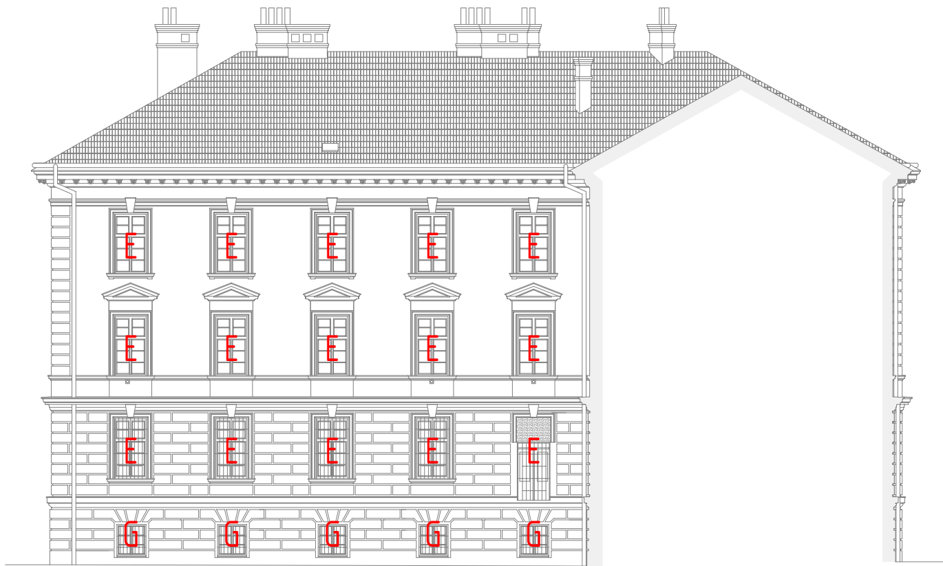
POHLED SEVEROVÝCHODNÍ - DVORNÍ